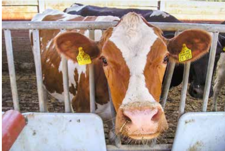
Für die Versuchsauswertung der OG Milch war die Messung der TS-Aufnahme unerlässlich.

Der erste Versuch hat von Ende Januar bis Anfang Mai 2018 auf dem Versuchsbetrieb Karkendamm der Universität Kiel stattgefunden. Dort wurde die Herde über den Transponder in eine Kontroll- und eine Versuchsgruppe eingeteilt und lediglich die Versuchsgruppe erhielt an der Kraftfutter-