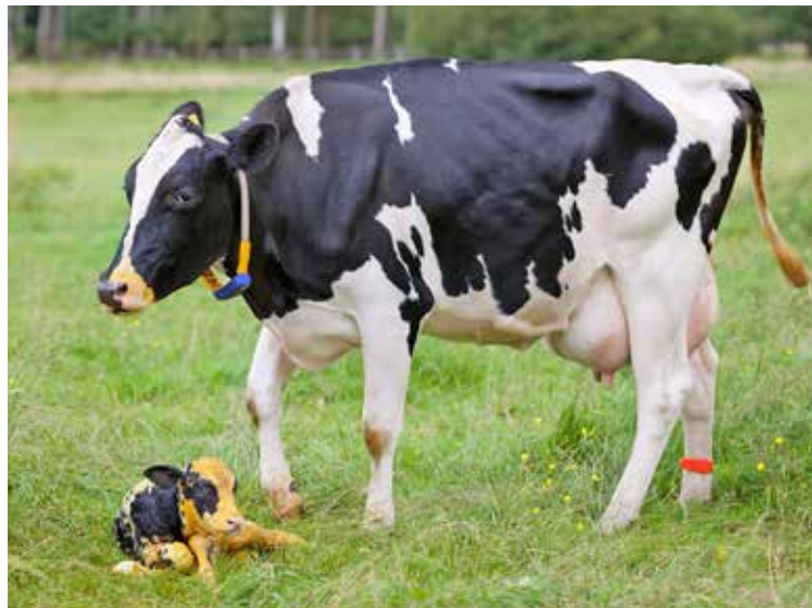
Auch für die Reproduktion benötigt die Kuh Aminosäuren.

Die N-Effizienz (Kilo Milch-N je Kilo aufgenommenem Futter-N) liegt in praxisüblichen Herden heute in Europa bei (nur) 25 bis 28 %. Durch Anpassung der Ration sowie einen gezielten Ausgleich der Ration mit Methionin und Lysin als erstbeziehungsweise zweitlimitierende Aminosäuren ist es möglich, die Effizienz auf 31 bis 35 % zu verbessern.