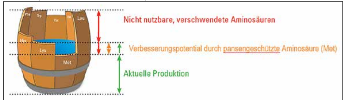
Die im Verhältnis zum Bedarf mangelnden Aminosäuren bestimmen, wie viel Milchprotein synthetisiert werden kann. In der Regel ist Methionin die erstlimitierende, Lysin die zweitlimitierende Aminosäure.

setzbarer Energie, da die Produktion von mikrobieller Masse zunächst von der Zufuhr an Energie abhängt. Das Aminosäuremuster des mikrobiellen Proteins unterliegt nur geringen Schwankungen, sodass hier mit konstanten Gehalten an Methionin und Lysin kalkuliert werden kann. Der Anteil von Aminosäuren, welcher aus dem im Pansen nicht abgebauten Protein resultiert, wird aus dem Anteil an pansenstabilem Protein (UDP) sowie dessen Aminosäuremuster geschätzt, wobei unterstellt wird, dass das Aminosäuremuster im UDP dem des ursprünglichen Futtermittels gleicht.