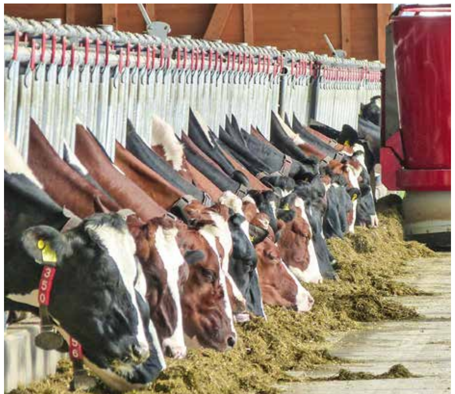
Gute Futteraufnahmen sind die wichtigste Basis für eine erfolgreiche Milchproduktion.

Über die Zulage von pansengeschütztem Methionin und gegebenenfalls Lysin kann jeglicher Mangel aus den bestehenden Rationen leicht ausgeglichen und damit auch die Verwertung des gefütterten nXP optimiert werden. In Deutschland ist die Zulage pansengeschützter Aminosäuren über Mischfutter oder Mineralfutter möglich und in den meisten Molkeereiprogrammen erlaubt. →