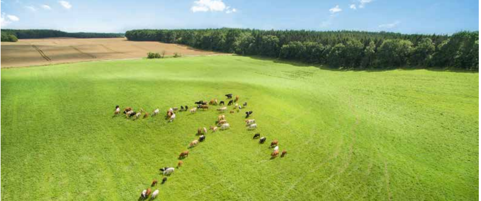
Mit Aminosäuren geht es vorwärts.